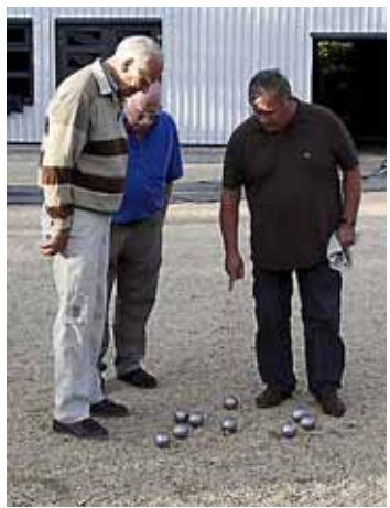
Jeu de boules bij De Gemshoorn.

Uit onderzoek moet blijken of de verdachten ook de sieraden van de slachtoffers bij zich hadden. Ook wordt uitgezocht of deze personen bij meer incidenten betrokken zijn geweest. De politie heeft de verdachten ingesloten voor verhoor.