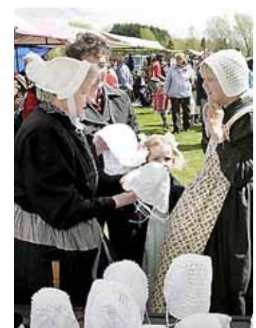
Oud en vertrouwd, maar altijd druk. ARCHIEF

Sinds maandag is de route Drakenburgerweg-De Geerenweg afgesloten voor doorgaand verkeer vanwege de vervanging van riolering. De klus gaat tot eind mei duren. Van de gelegenheid wordt slim gebruikgemaakt door meteen ook het tankstation tegenover De Trits te slopen en te vervangen door nieuwbouw.