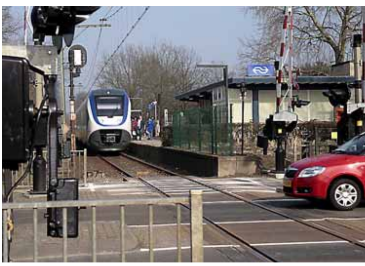
Toekomst station Soest Zuid nog ongewis.

Ellen Evers zingt op toneel over mannen en liefde