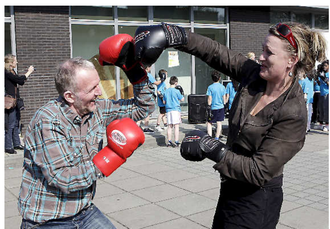
Van Berkel en Sheldon met elkaar in de clinch.

De drie basisscholen Van der Huchtschool 3, Egelantier en Waterinkschool doen in de wijk mee aan het project. Het is voor leerlingen van de groepen 7 en 8 die nog geen lid zijn van een vereniging, een wekelijks terugkerende sportmiddag. Voor de keuze van aan te bieden activiteiten heeft Balans vooraf een enquête gehouden. Doel is het terugdringen van overgewicht en het verbeteren van de fysieke conditie van de jeugd. Deelname aan het uur sporten, elke week van een tot twee uur, kost vijf euro. Bij gebleken succes wil Soest de sportmiddag ook naar andere wijken uitrollen. Vooral de jeugd die nog geen lid is van een sportclub behoort tot de doelgroep.