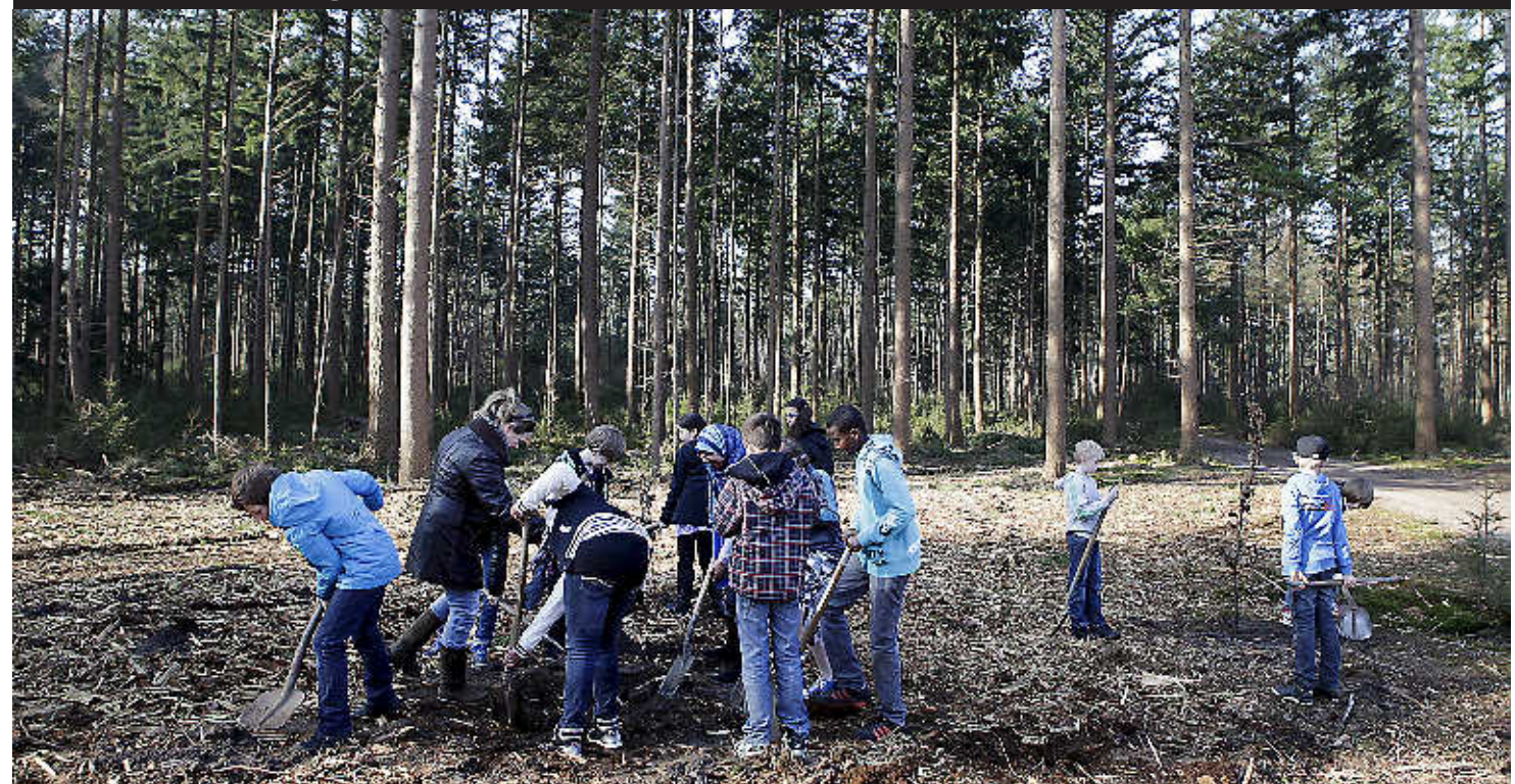
AARN - Tientallen Baarnse schoolkinderen trokken gisterochtend het Paardenbos achter de marchaussekazernes in om bomen te planten. Blijf het feest de laatste jaren wegens gebrek aan plantlocaties meestal beperkt tot een educatief moment over bomen, dit keer kon er weer